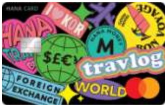
하나 트래블로그 ISIC 국제학생증 체크카드

해외여행 또는 어학연수를 준비 중인 학생들의 International Student life 증진을 도모하고자 하나 트래블로그 ISIC 국제학생증 체크카드 발급비 지원 행사를 준비하였습니다. 많은 학생들이 지원받을 수 있도록 행사 진행 협조 요청 드립니다.