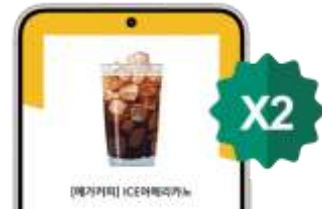
메가커피 아이스 아메리카노 모바일 쿠폰 2매 제공